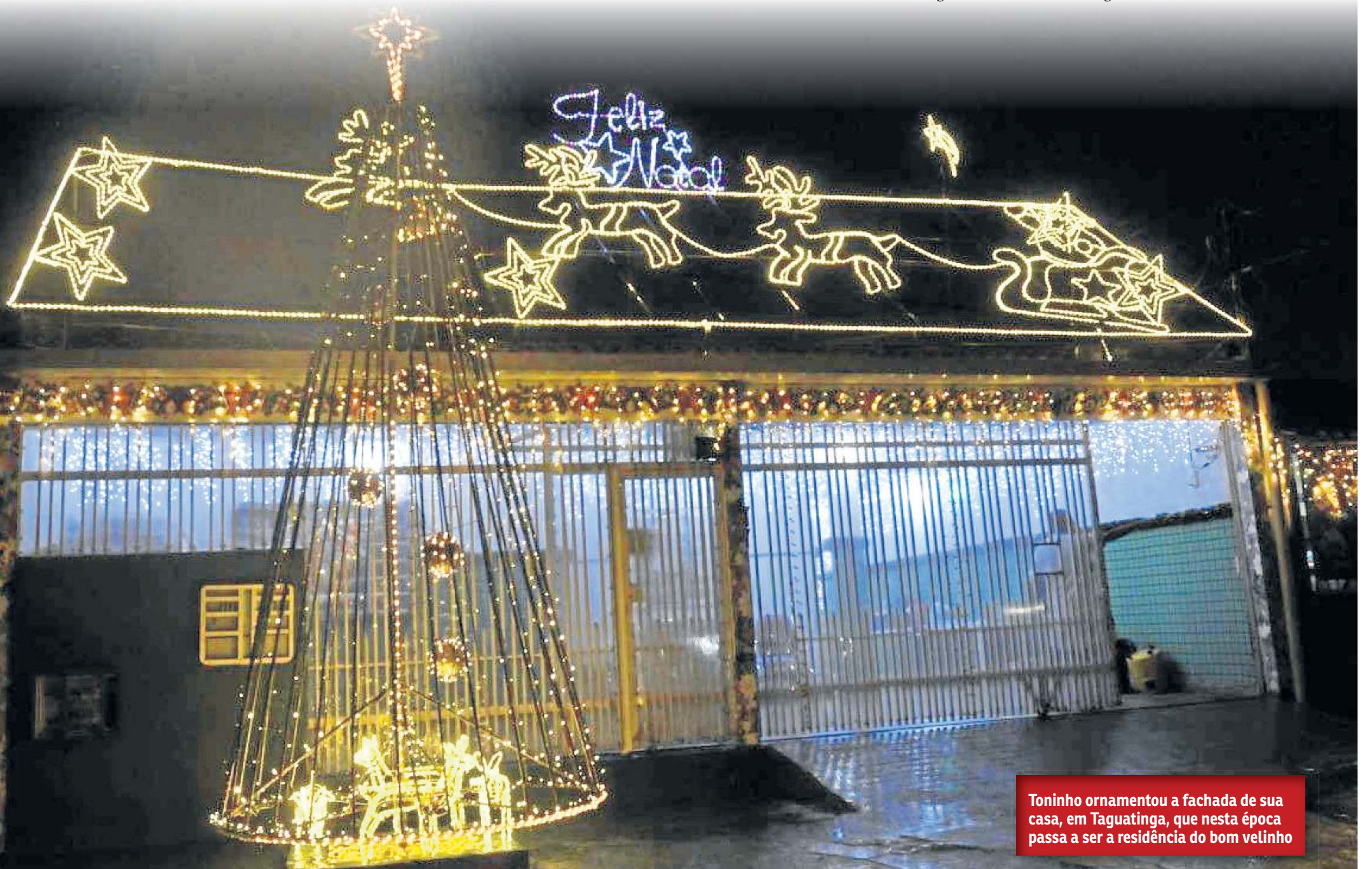
Toninho ornamentou a fachada de sua casa, em Taguatinga, que nesta época passa a ser a residência do bom velhinho

Devido à versatilidade de seu trabalho, Noel precisa de pontos de apoio. Em outro cantinho mágico de Brasília,