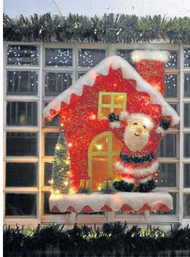
A decoração da Casa do Papai Noel, na M Norte em Taguatinga, não deixa nenhum espaço vazio

conta com mais uma residência especial montada no Setor Militar Urbano (SMU). Construída com madeira ecológica, essa Casa do Papai Noel conta com quarto, sala, banheiro e varanda — tudo decorado de forma a transmitir aconchego e com objetos que nos levam direto ao mundo do bom velhinho.