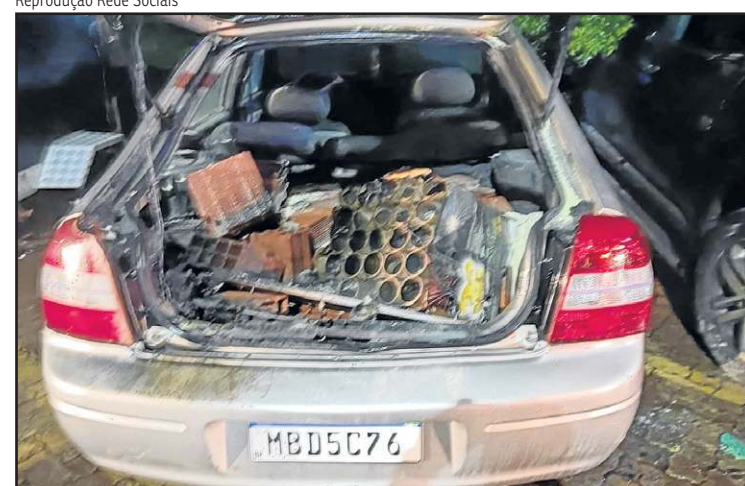
Carro onde ocorreu a primeira explosão, no anexo IV da Câmara