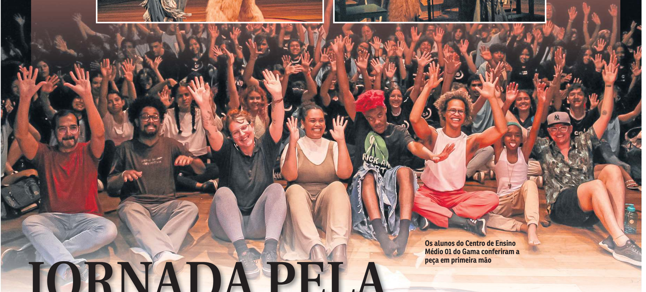
Os alunos do Centro de Ensino Médio 01 do Gama conferiram a peça em primeira mão