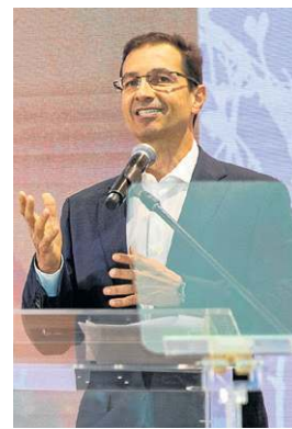
Mariana Campos/CB/DA Press