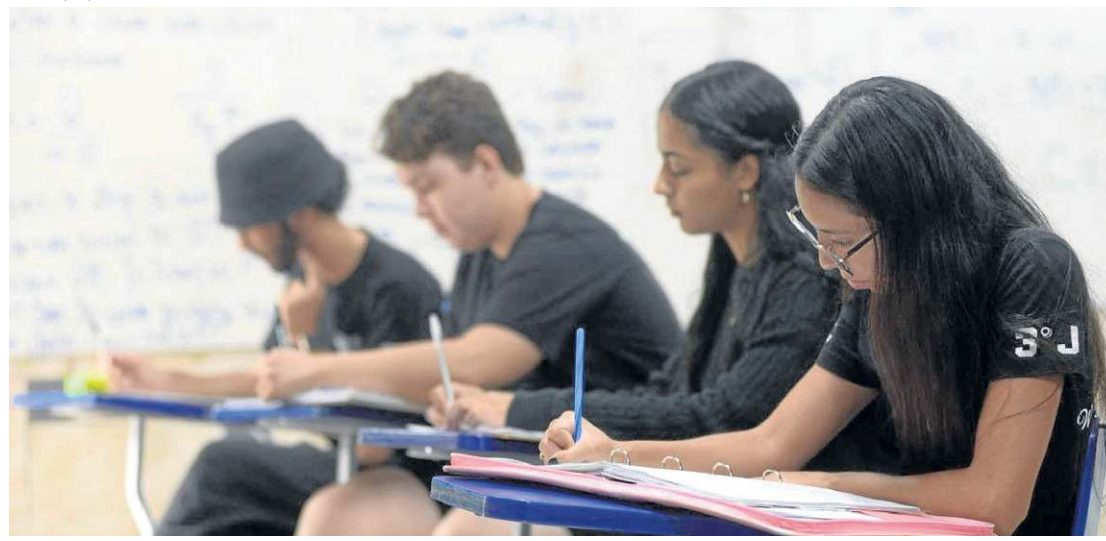
Alunos do Centro de Ensino Médio de Taguatinga Norte em expectativa para os dois finais de semana de prova

sem expectativas exageradas. É necessário estar disponível para ouvir e conversar, pois compartilhar preocupações pode aliviar a carga emocional”, afirma.