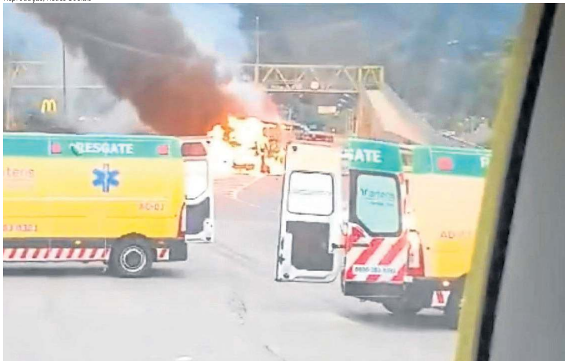
Torcedores do Cruzeiro passavam pela Fernão Dias retornando de Curitiba a BH quando foram agredidos

concessionária da Fernão Dias, prestaram atendimento aos feridos, levados para o Pronto-Socorro Anjo Gabriel, em Mairiporã.