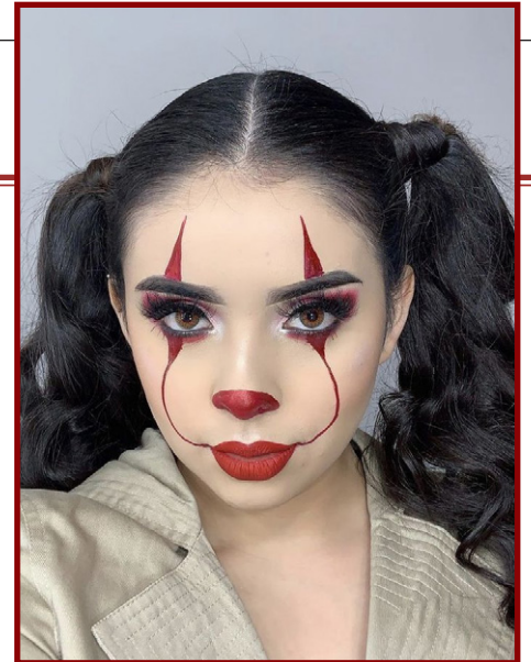
A maquiagem de palhaço pode ser feita de diversas formas, desde as mais simples, até mais complexas