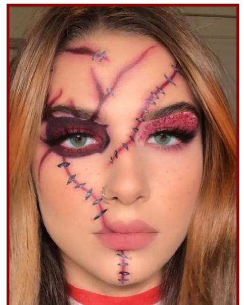
Juntos, batom e sombra podem criar o efeito de cortes