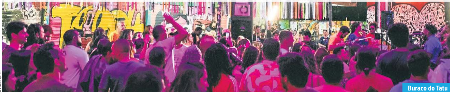
Buraco do Tatu

Buraco do Tatu traz sambistas experientes para o Setor de Diversões Sul a fim de celebrar com música brasileira em um dos cenários icônicos na cidade. A festa começa às 17h e mistura sets de DJs com blocos de samba que seguem com a folia até a meia noite.