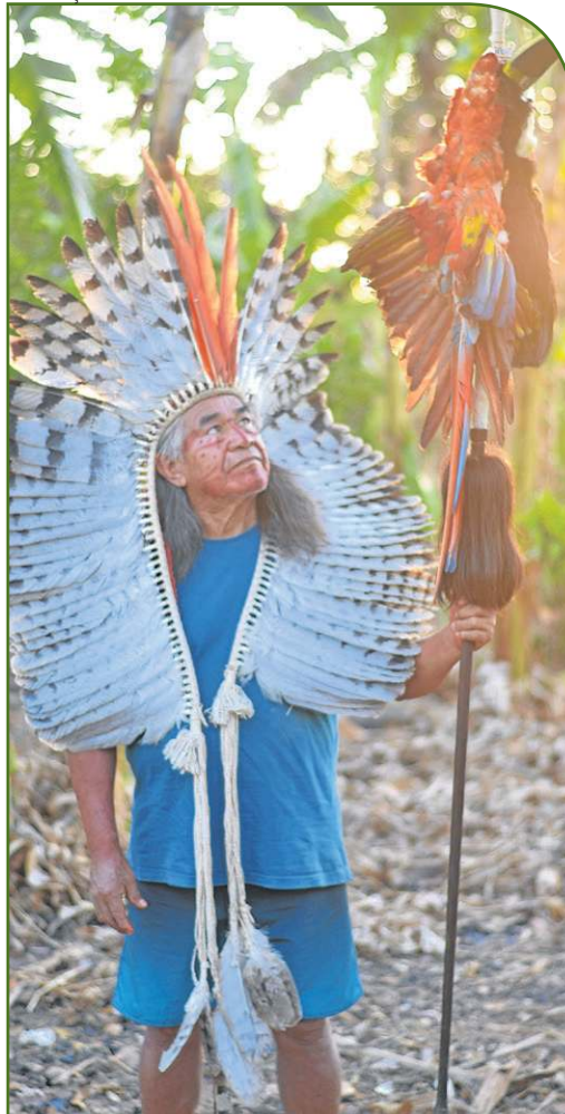
Exposição mostra a vida e a luta do líder indígena Álvaro Tukano na Casa Yepa -Mahsã, no Setor Noroeste. ARTES VISUAIS, PÁGINA 19