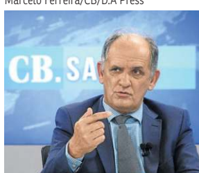
Marcelo Ferreira/CB/D.A. Press