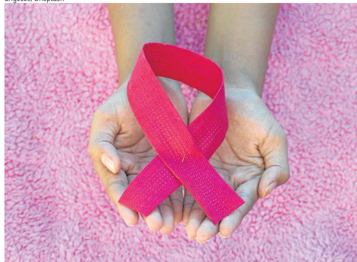
O evento ocorre no Outubro Rosa, de prevenção ao câncer de mama