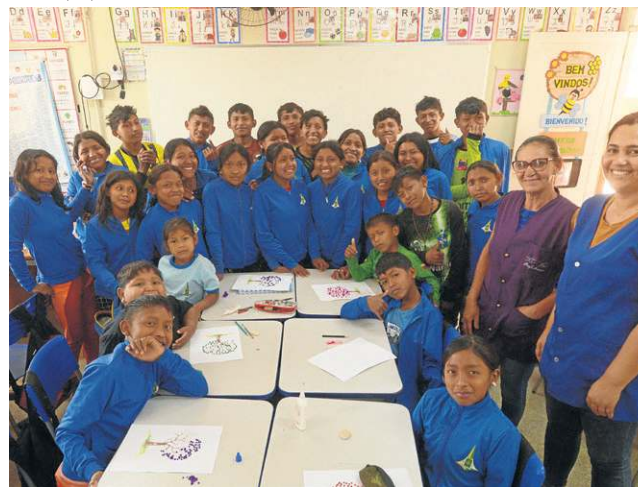
Venezuelanos têm aulas de idiomas no Café sem Troco