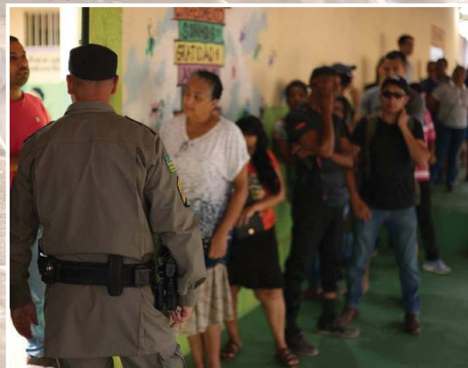
PM de Goiás garantiu a segurança nos locais de votação