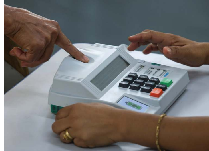
Identificação biométrica elimina a possibilidade de fraudes