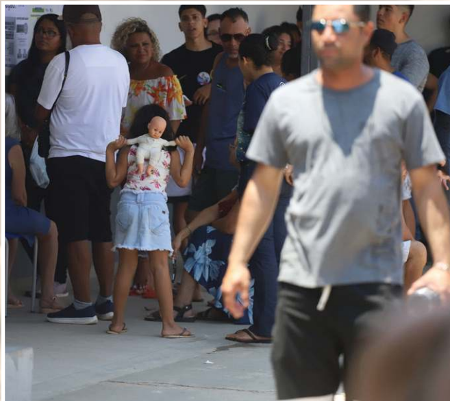
Movimentação de eleitores foi grande durante todo o dia