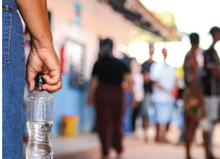
Garrafinhas de água foram itens obrigatórios no pleito