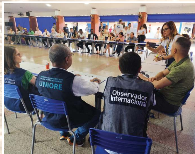
Representantes da Organização dos Estados Americanos