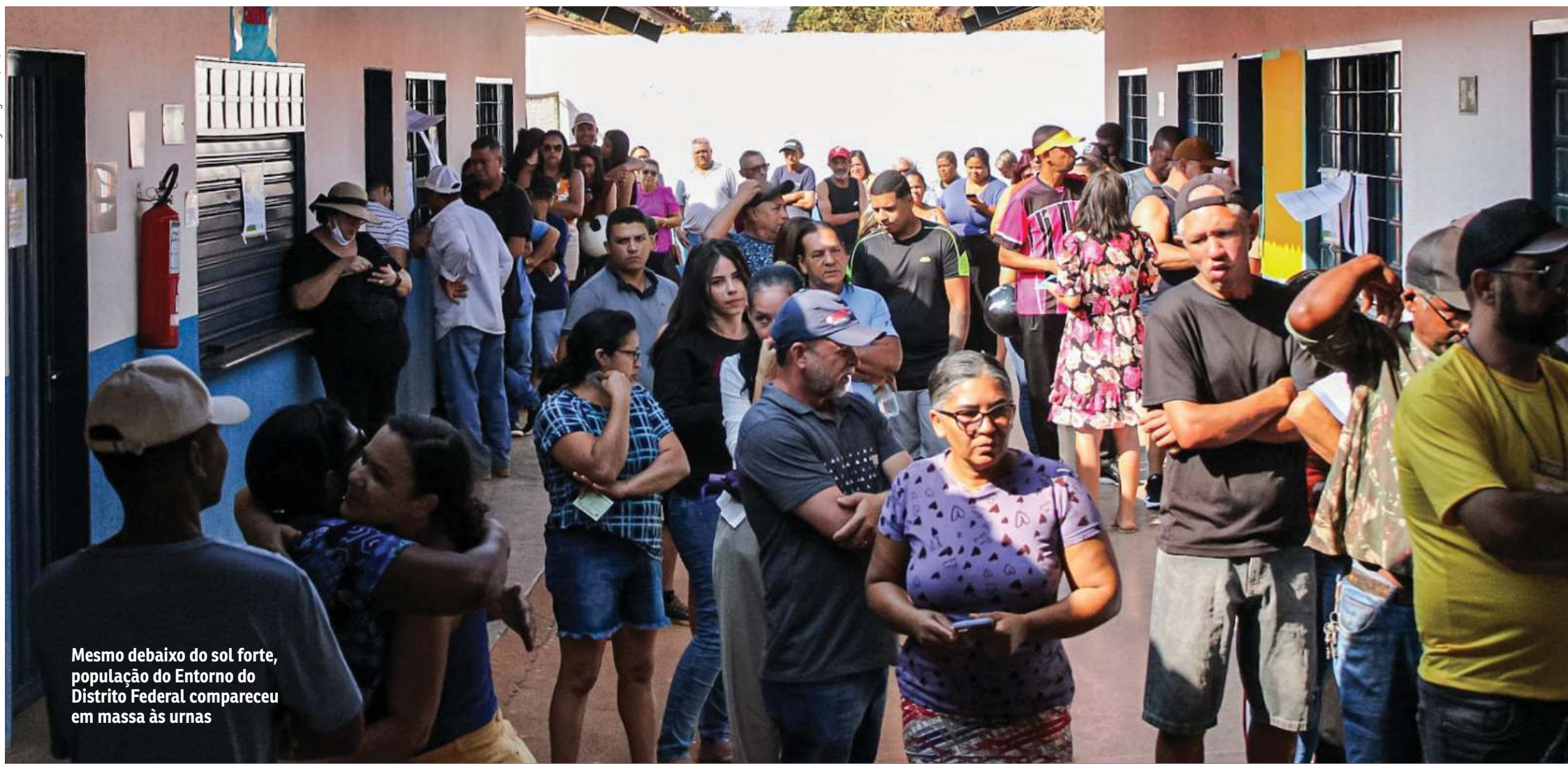
Mesmo debaixo do sol forte, população do Entorno do Distrito Federal compareceu em massa às urnas