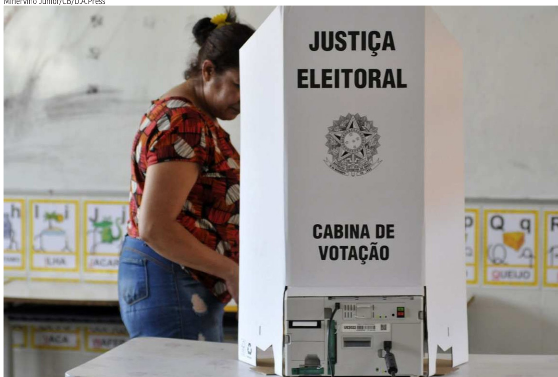
Urnas comprovaram que eleitores da região apoiam uma pauta política e social mais conservadora