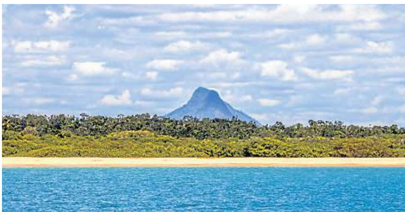
Praia com o Monte Pascoal ao fundo