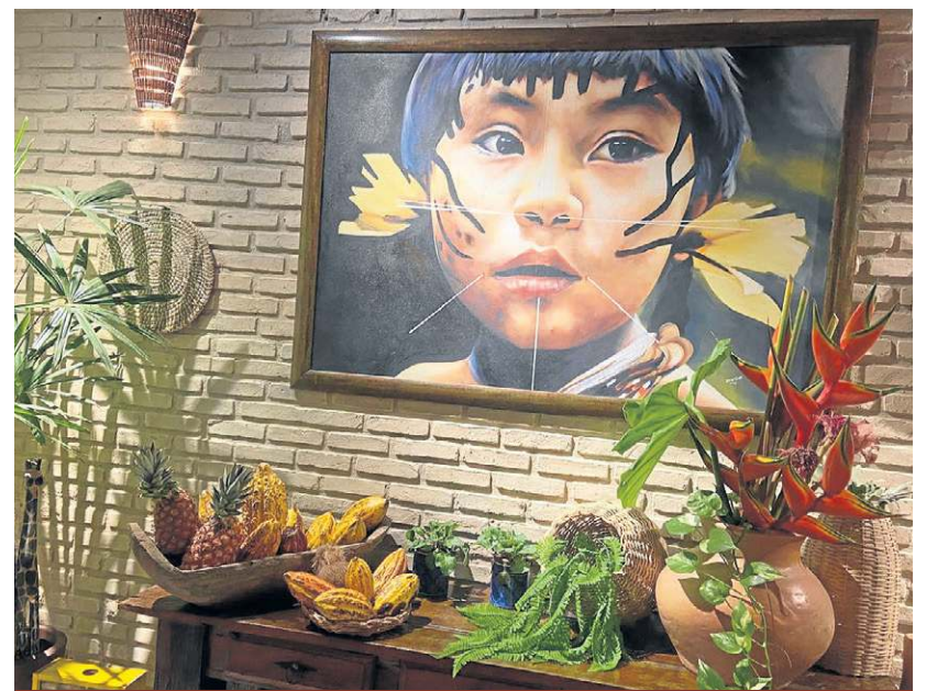
A arte local é muito valorizada em pousadas e restaurantes