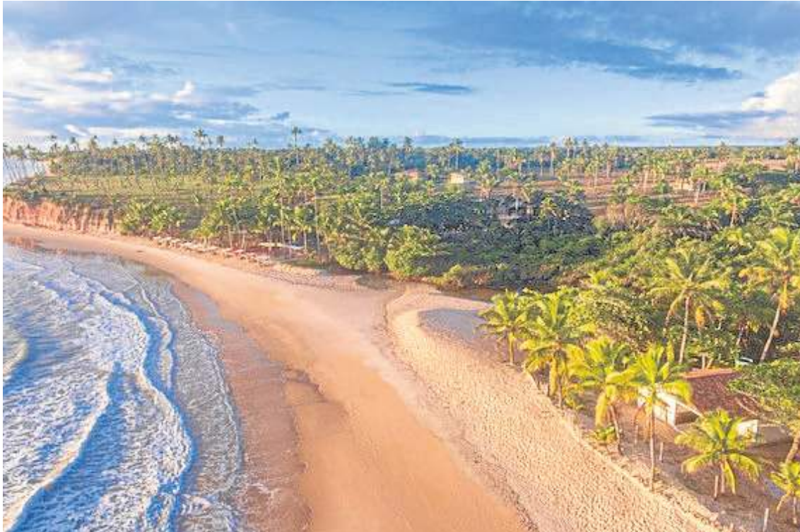
As falésias tornam a região ainda mais charmosa