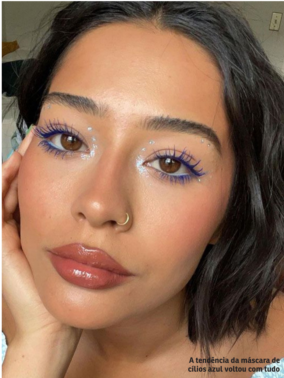
A tendência da máscara de cílios azul voltou com tudo