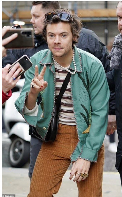
O estilo de Harry Styles tem como inspiração os anos 70

Um dos elementos-chave do estilo casual masculino são as camisas de algodão, regatas e overshirts. O cantor Shawn Mendes, por exemplo, é frequentemente visto usando camisas em cores neutras, que são peças versáteis, capazes de compor diversos looks. As overshirts, que são camisas mais longas e leves, também são ótimas opções para sobreposições, permitindo que o homem jogue com camadas e texturas.