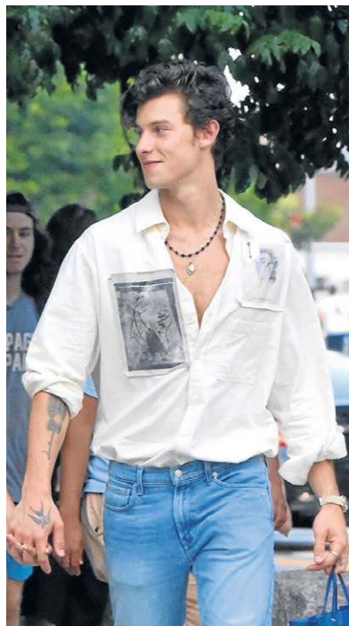
Shawn Mendes investe em cores neutras

Nina sugere que os homens explorem mais opções de acessórios. "Normalmente no masculino casual, eles investem só no relógio, no máximo óculos escuros, mas podem trazer algumas correntes, pulseiras, anéis diferentes para complementar o look", a stylist analisa a mudança cultural, na qual os homens estão mais abertos a