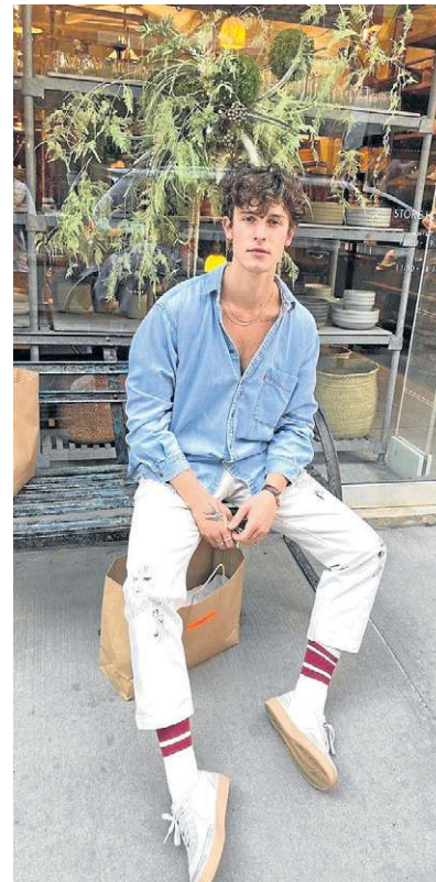
Neste look, o jeans ganha um charme a mais

O oversized também está voltando para o masculino, principalmente em estilos mais modernos e na pegada street. A tendência oversized permite conforto e liberdade de movimento, ao mesmo tempo que oferece uma estética contemporânea. Com a incorporação de peças como camisetas amplas, jaquetas e calças largas,