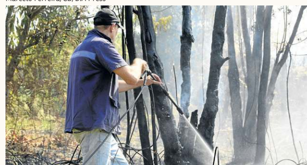
Alerta no aeroporto — Os bombeiros contaram com a ajuda de moradores do Park Way (foto) para conter um incêndio ao lado de uma das pistas do terminal. PÁGINA 15