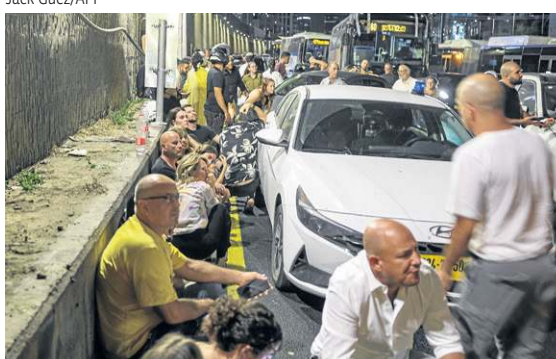
Cidadãos se protegem em rodovia perto de Tel Aviv (E); em Ramallah, palestinos observam projétil (D)