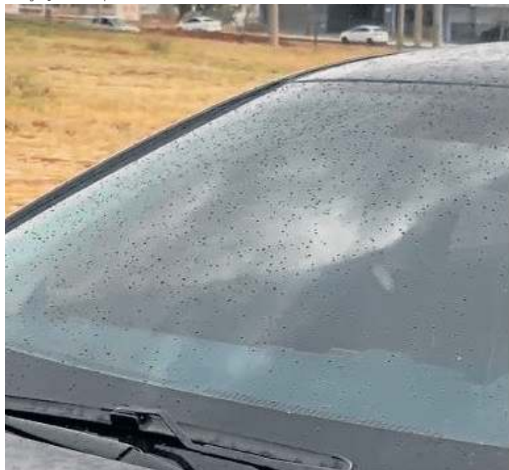
Registro de pingos de chuva no vidro de carro em Samambaia

TEMPO / Depois de 157 dias de estiagem, algumas cidades do DF registraram precipitações. A previsão é de que o cenário seja o mesmo hoje