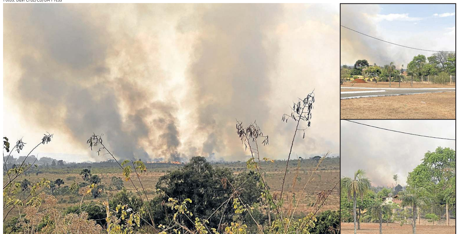
Incêndio florestal na altura da QI 17 do Lago Sul mobilizou bombeiros militares e também civis do aeroporto JK. Pista foi liberada no final do dia

A situação se agrava pelo longo período de seca enfrentado pelo Distrito Federal.