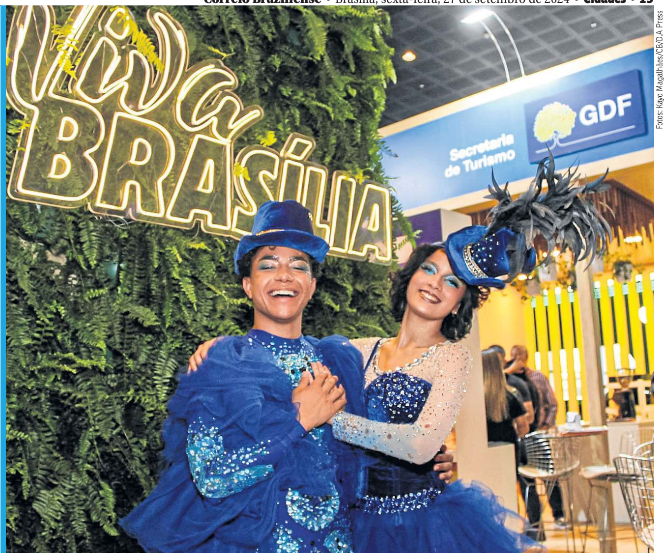
Além de empresas relacionadas ao turismo, o evento recebe estandes de todos os estados brasileiros, mais o Distrito Federal

1.500 marcas de toda a cadeia do turismo