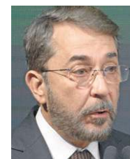
Guilherme Machado (Correio)