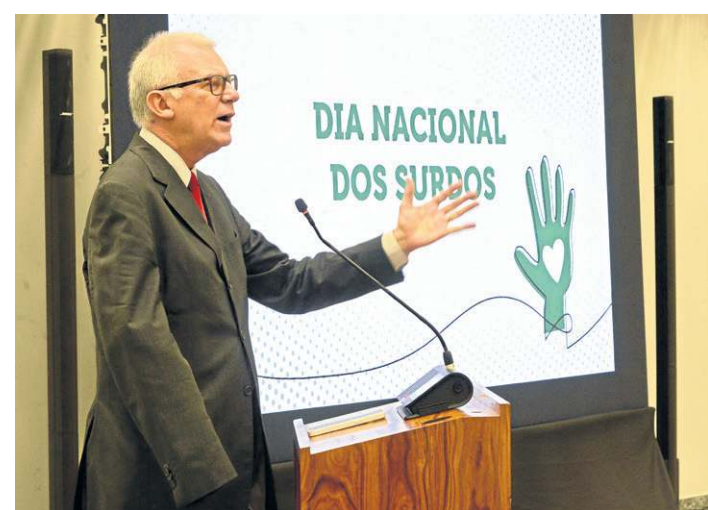
Ministro Sérgio Kukina destacou o bom desempenho dos surdos

Recentemente, o tribunal inaugurou o atendimento da Ouvidoria na Língua Brasileira de Sinais (Libras) e, desde maio de 2020, transmite sessões de julgamento com tradução simultânea para Libras. Todos os eventos contam com tradutor na língua de sinais.