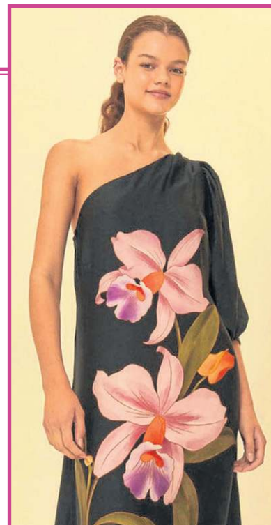
A marca brasileira Farm traz uma estética suave e jovial com as orquídeas em sua nova coleção

*Estagiária sob a supervisão de Sibelegromonte