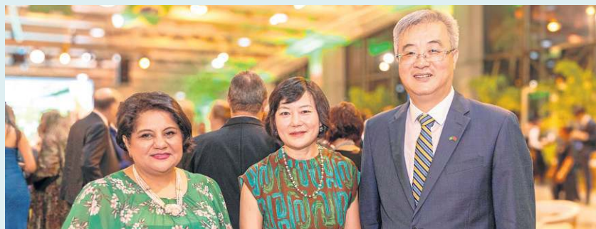
A embaixadora do Egito, Mai Khalil, a embaixatriz da China, Zhou Yongmei, e o embaixador da China, Zhu Qingqiao