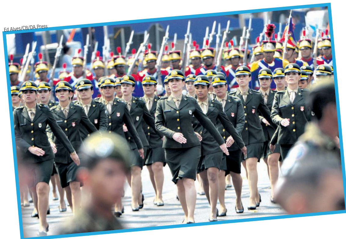
E4 Alves/CB/D.A. Press