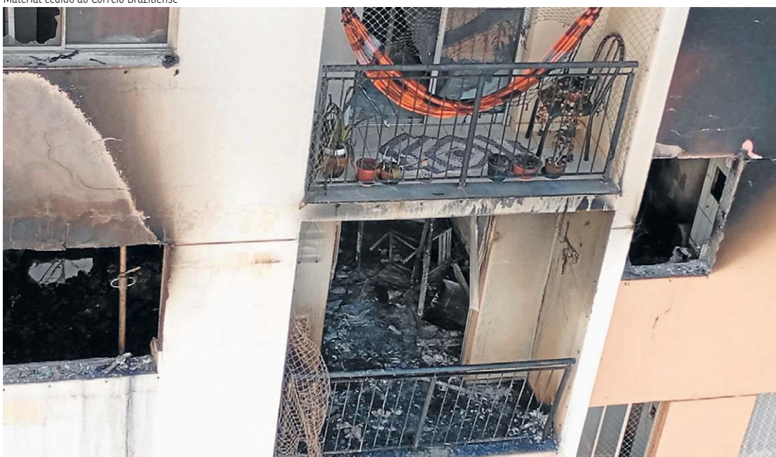
Incêndio que deixou três mortos pode ter sido causado por produto utilizado na impermeabilização de sofás