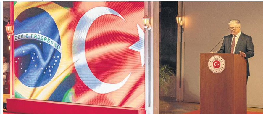
O embaixador da Turquia no Brasil, Halil Ibrahim Akça