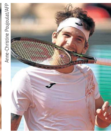
Em seguida, a partir das 13h15, Thiago Wild encara o russo Andrey Rublev, número 6 do mundo