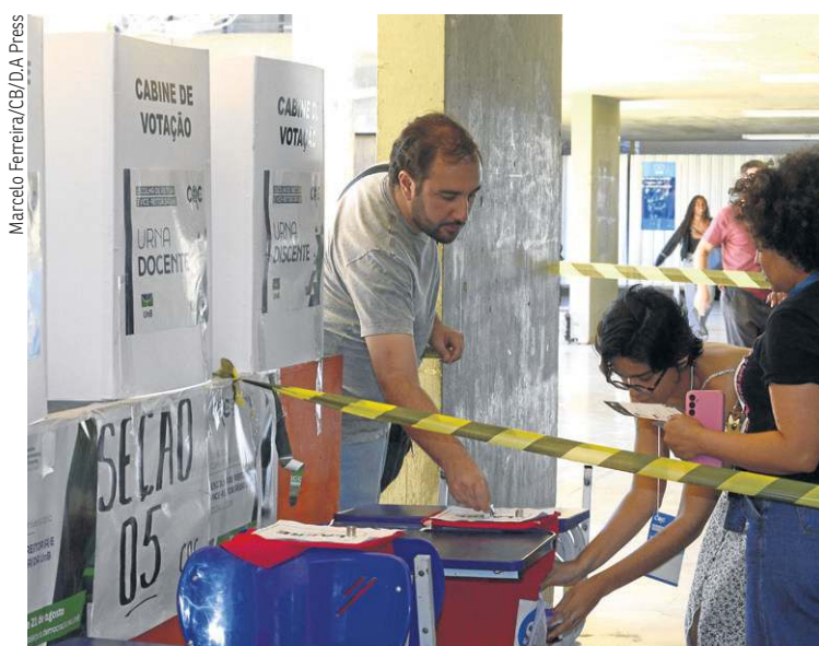
Apenas 15,98% do total de votantes foi às urnas na consulta

Para garantir a presença da sua escola, entre em contato pelo número (61) 3214-1218/1378 ou aponte a câmera para o QR CODE