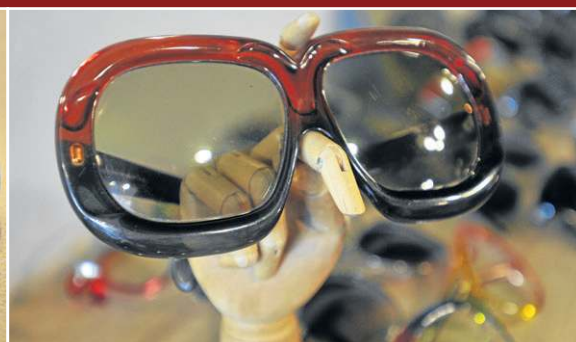
Brechó do Óculos: Óculos Dior anos 70 (R$ 1500)