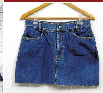
Brechó To Face: Saia jeans curta (R$ 60)