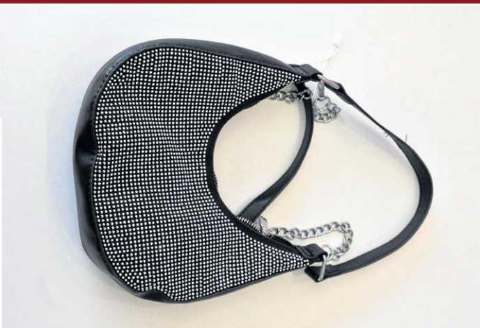
B ao Quadrado: Bolsa preta com pedras (R$ 79)