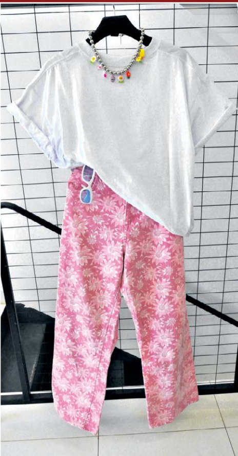
Bao Quadrado: Camiseta (R$ 39); Colar (R$ 33); Óculos (R$ 50); Calça (R$ 99)