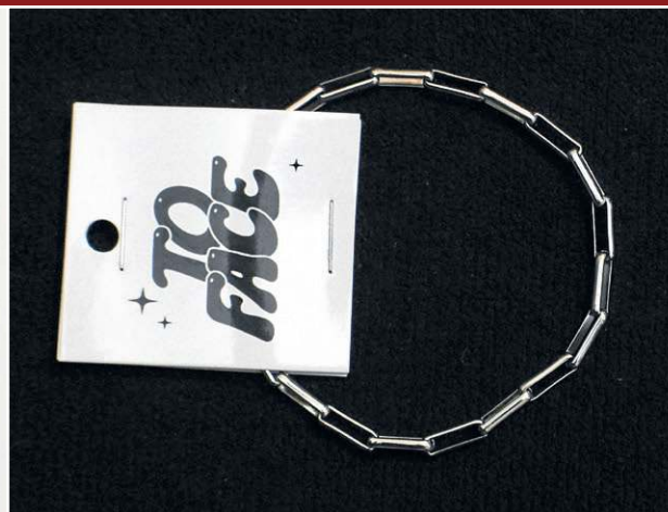
Brechó To Face: Pulseira prata (R$ 30)