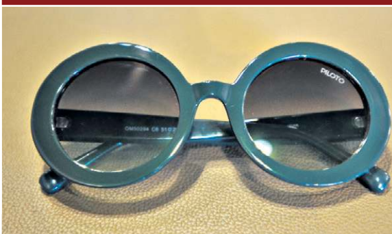
Brechó do Óculos: Óculos verde (R$ 140)