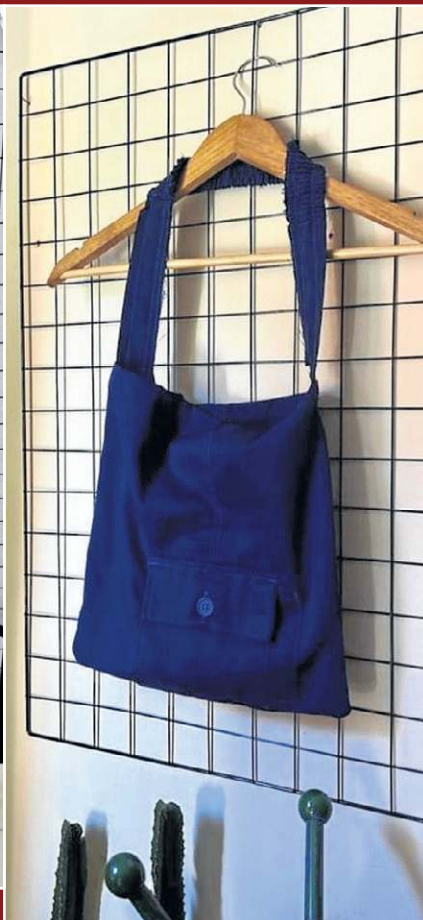
Singular Studio Fashion: Bolsa em upcycling (R$ 40)