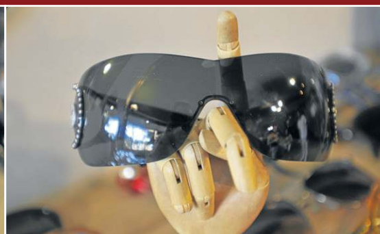
Brechó do Óculos: Óculos Versace anos 2000 (R$ 580)