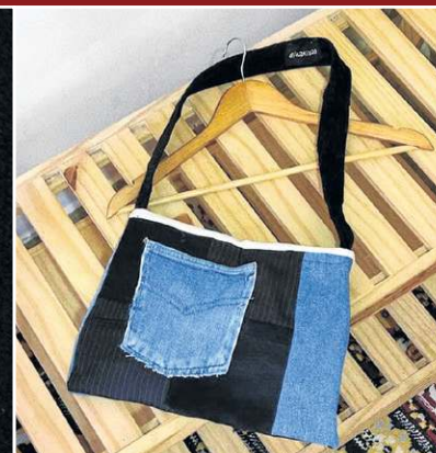
Singular Studio Fashion: Bolsa produzida através de resíduos têxteis (R$ 40)