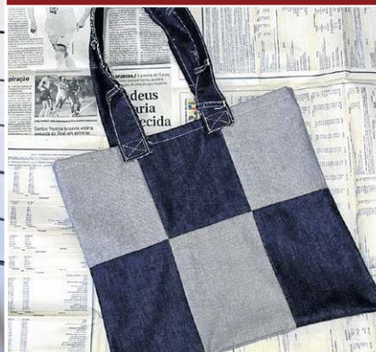
Singular Studio Fashion: Bolsa em patchwork (R$ 55)