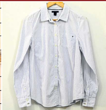
Brechó To Face: Camisa listra Tommy Hilfiger (R$ 65)