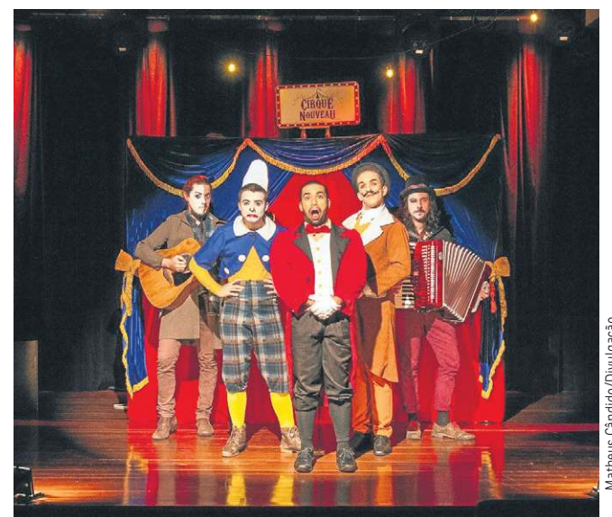
Elenco cênico e musical do espetáculo Stupide

Amanhã, às 10h30 e às 14h, no Bananika (CLN 205, bloco C, Loja 10). Oficina de arte conta a história de Yayoi Kusama e coloca crianças para criar suas próprias obras de arte. Ingressos no valor único de R$ 90 + taxa do Sympla.