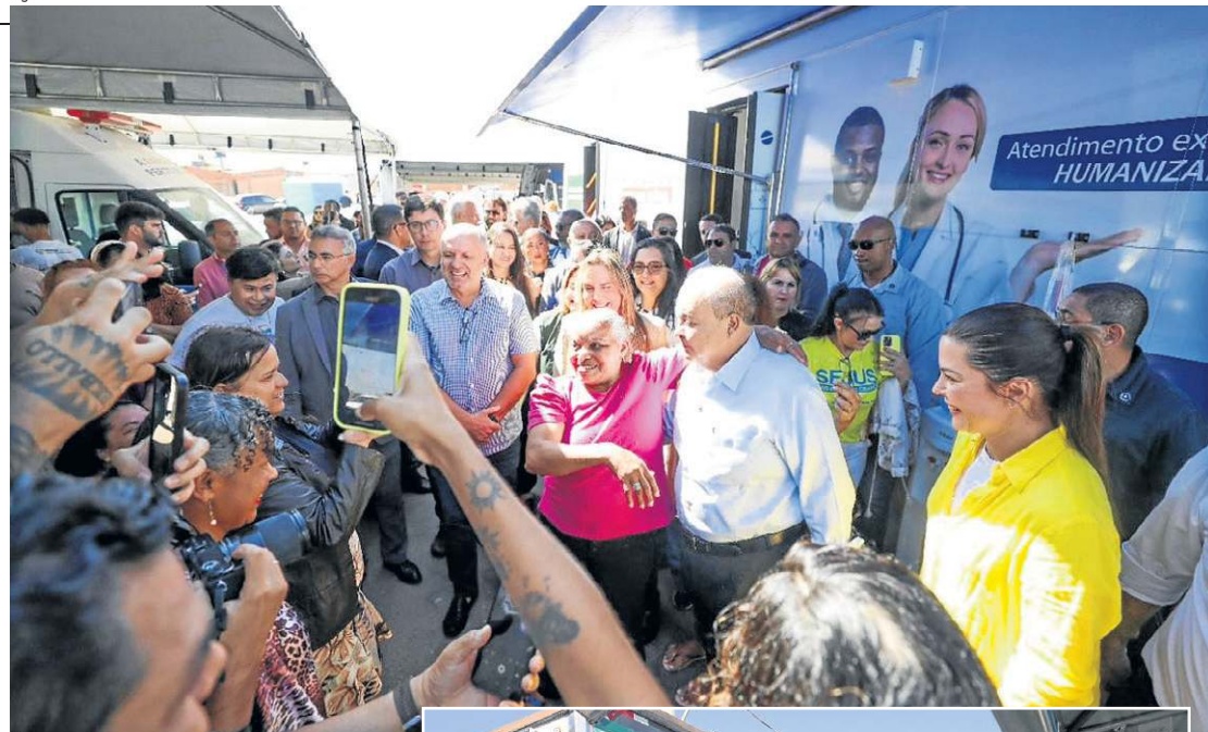
- Governador Ibaneis Rocha participa do lançamento do programa Saúde Mais Perto do Cidadão

Estrutura é composta por carretas e ônibus e foi montada no Trecho 2 da cidade