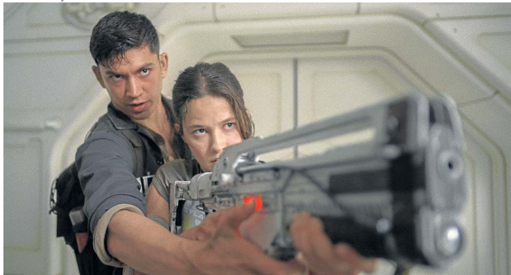
Archie Renaux e Cailee Spaeny em Alien: Romulus