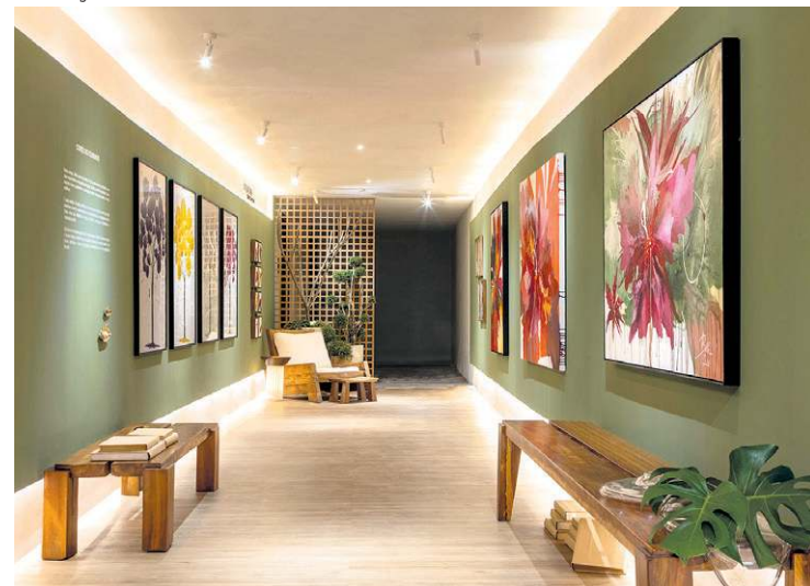
A Olzi Arquitetura usou a beleza das obras feitas por Bella Salvati