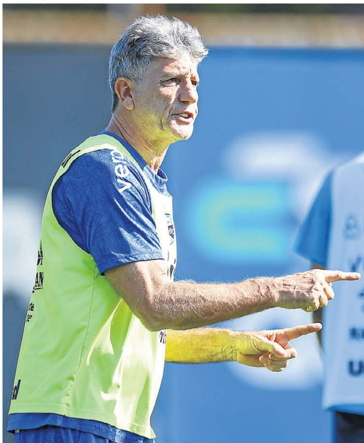
Na equipe do Sul, Renato Gaúcho busca ajustes no setor ofensivo