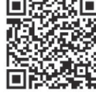
Aponte a câmera do seu celular e veja as ofertas!

ACONTECE IMOBILIÁRIA LUGAR CERTO.COM.BR Os melhores imóveis de Brasília você encontra aqui!