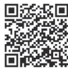
Aponte a câmera do seu celular e veja as ofertas!

J. RIBEIRO LUGAR CERTO Os melhores imóveis de Brasília você encontra aqui! Veja as ofertas!