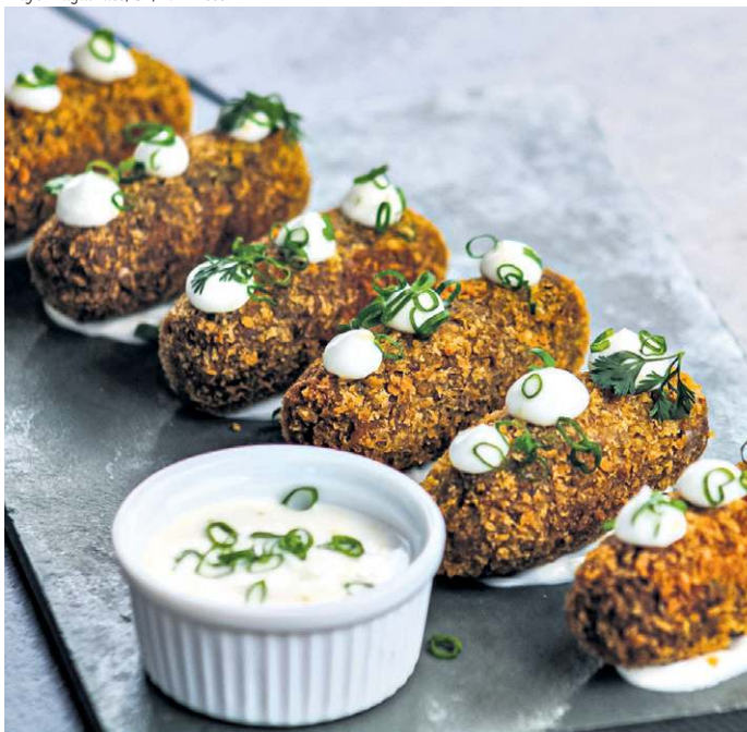
Croquete de carne de panela do Blocogê

porção de croquete de carne de panela (R$ 35). “Como todo bom petisco de boteco, ela vai muito bem com uma