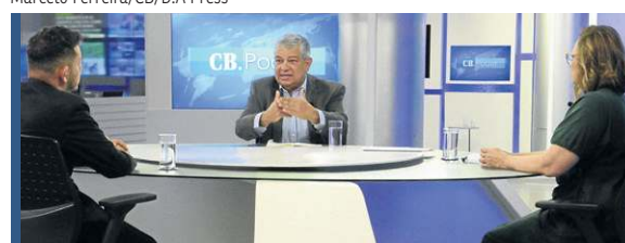
Marcelo Ferreira/CB/D.A Press