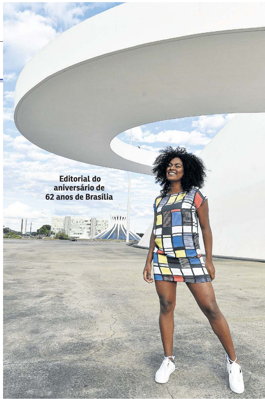
Editorial do aniversário de 62 anos de Brasília