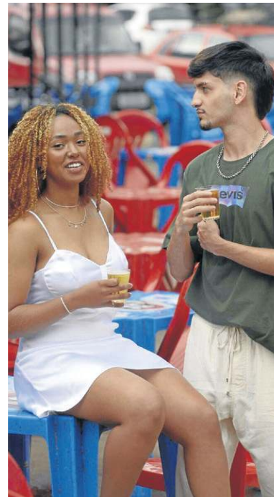
O espírito de brasilidade inspirou um dos editoriais de fim de ano