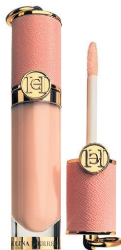
Herrera Beauty Good Girl Gloss, de Carolina Herrera (R$ 235)