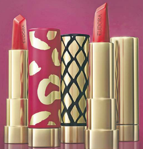
Amulips, da Eudora (R$ 20 case e R$ 39,90 cada refil)