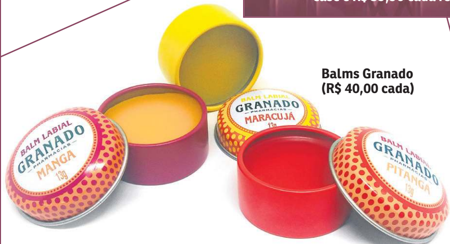
Balms Granado (R$ 40,00 cada)