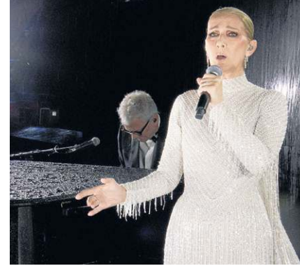
Emocionada, a cantora canadense Celine Dion protagonizou o ato final