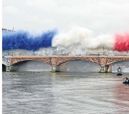
Fogos com as cores francesas explodiram sobre a Pont d'Austerlitz