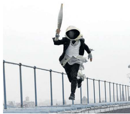
Arno Dorian, personagem da série 'Assassin's Creed', carregou a tocha olímpica