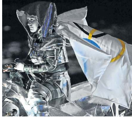
Uma amazona com armadura prateada brilhou sobre as águas do Rio Sena