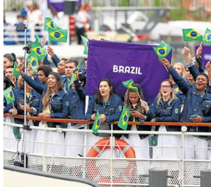
Barco brasileiro foi ocupado por 50 atletas de 16 esportes, além dos oficiais