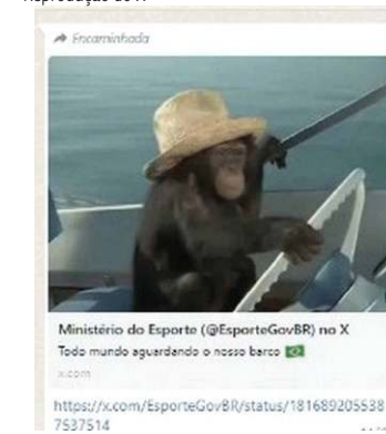
Imagem de macaco pilotando barco foi publicada na rede X