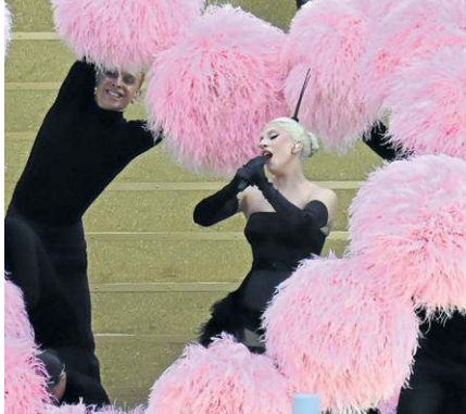
Com apresentação gravada, a cantora Lady Gaga marcou presença na festa