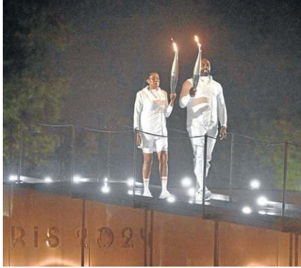
A ex-velocista Marie Perec e o judoca Teddy Riner acenderam a pira olímpica