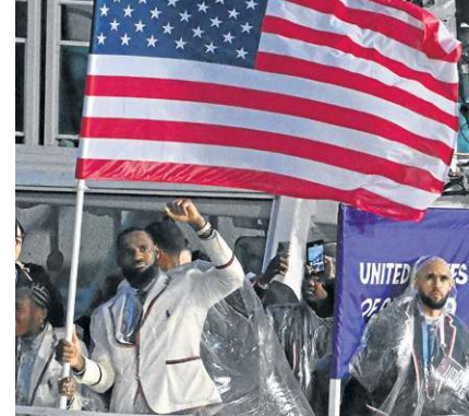
O astro do basquete LeBron James foi o porta-bandeira dos Estados Unidos