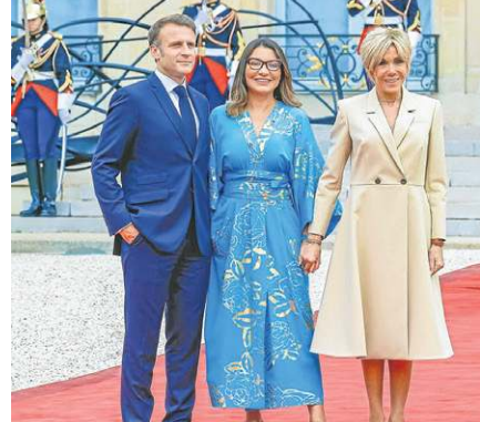
O presidente Emmanuel Macron, com as primeiras-damas Janja e Brigitte