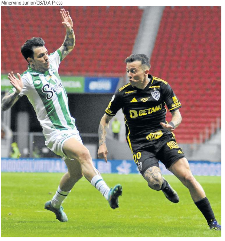
Camisa 20 entrou em campo pela primeira vez desde o retorno ao Brasil

*Estagiários sob a supervisão de Marcos Paulo Lima