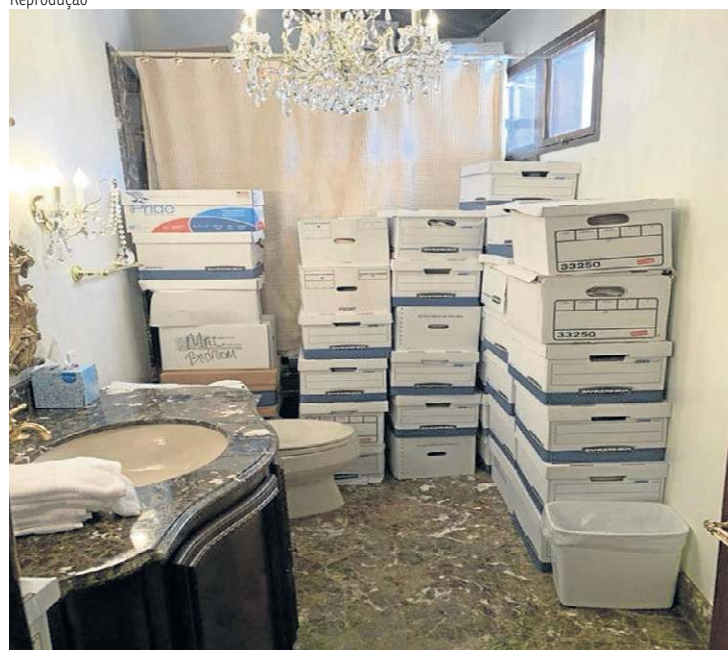
Caixas de dossiês armazenadas no banheiro da mansão de Mar-a-Lago