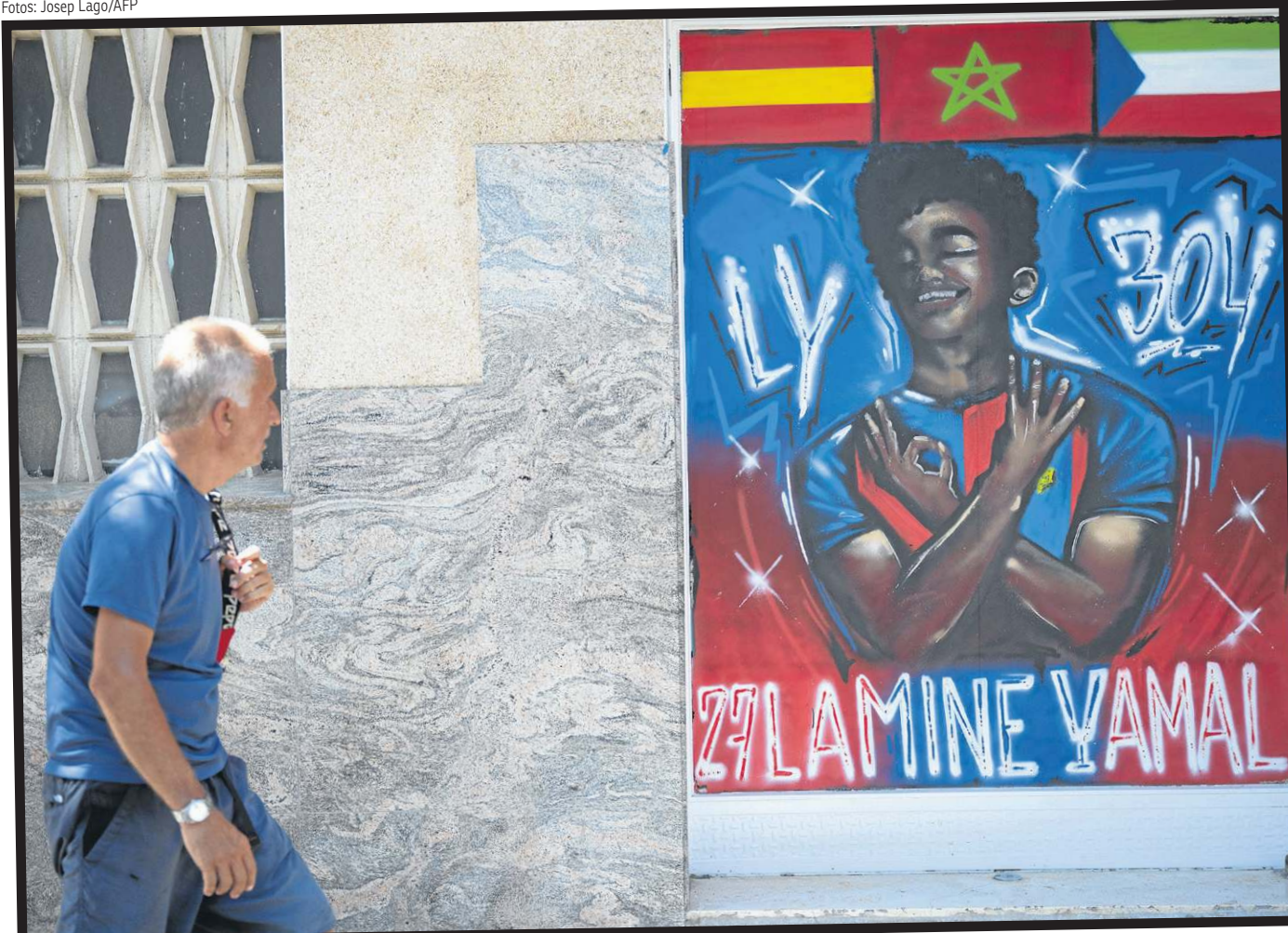
Cenas da vida no bairro de Rocafonda, em Mataró, a 30km de Barcelona. Ali nasceu e foi criado o astro do Barcelona e da Espanha