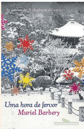
Companhia das Letras

No leito de morte, Haru se recorda do relacionamento de 10 dias com a francesa Maud, do qual nasceu Rosa, a filha com a qual ele nunca teve contato. O livro retoma o enredo de Uma rosa só, também de Muriel Barbery, que conta a história da mulher que vai ao Japão receber a herança de um pai que não conheceu.