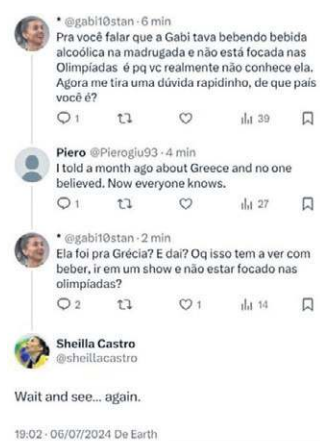
Diálogo entre o suposto perfil fake de Sheilla com uma fã da capitã Gabi no X, antigo Twitter