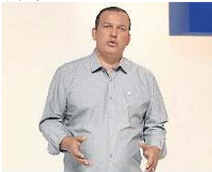
Eurípedes pediu afastamento do Solidariedade por tempo indeterminado