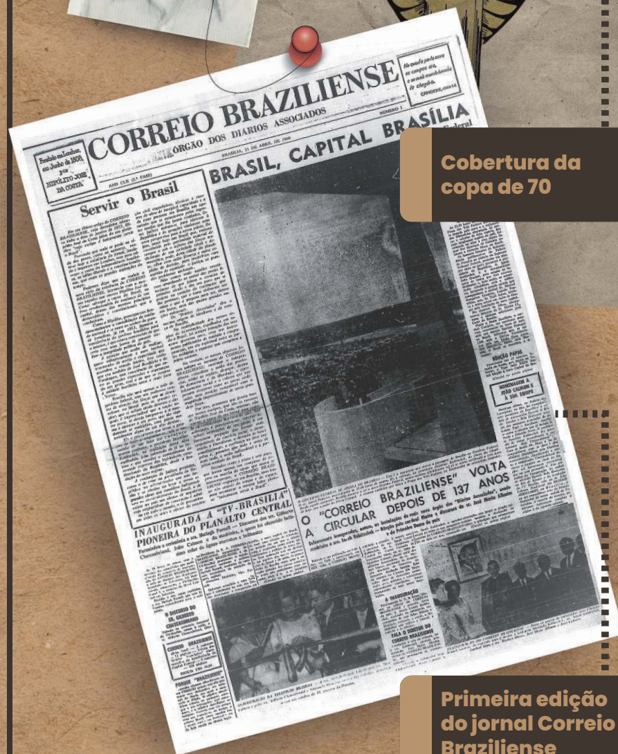
Primeira edição do jornal Correio Braziliense