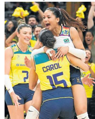
Brasil perdeu sete parciais em oito jogos pela Liga das Nações

O técnico José Roberto Guimarães elegeu os "alvos" da Seleção Brasileira feminina de vôlei na aguardada partida contra a Polônia, hoje, às 9h30, pela etapa de Hong Kong da Liga das Nações. No duelo entre as duas equipes invictas na competição até agora, o treinador apontou preocupação com a oposta Magdalena Stysiak e com a levantadora Joanna Wolosz.