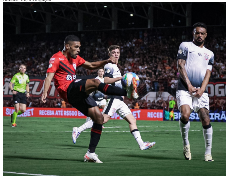
Corinthians ostenta invencibilidade de três jogos contra o Atlético-GO