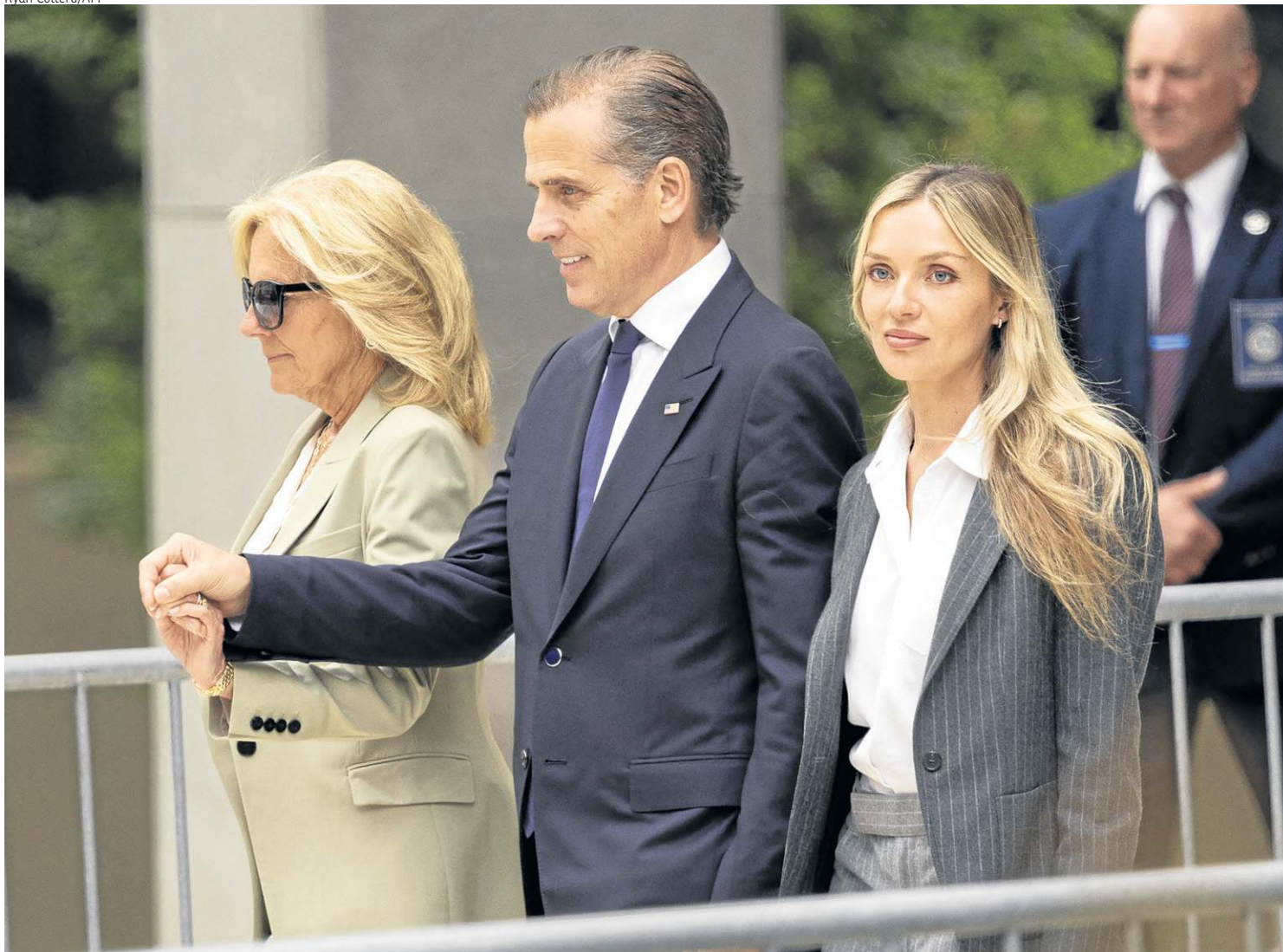
A primeira-dama dos EUA, Jill Biden (E), o filho Hunter e a nora Melissa Cohen deixam o prédio da Corte Federal em Wilmington, após o veredicto

culpado “por suas decisões ilegais de quando estava no auge do vício, por sua decisão de mentir em uma declaração oficial para comprar uma arma e depois por sua decisão de mantê-la em sua posse” e não devido à dependência em drogas e álcool.