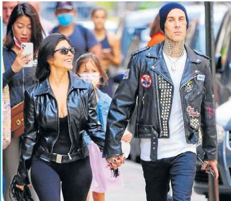
Kourtney Kardashian e Travis Barker com jaquetas de couro e looks coordenados