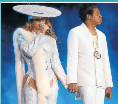
Beyoncé e Jay-z sempre apostam em outfits coordenados, o casal costuma investir nas mesmas cores