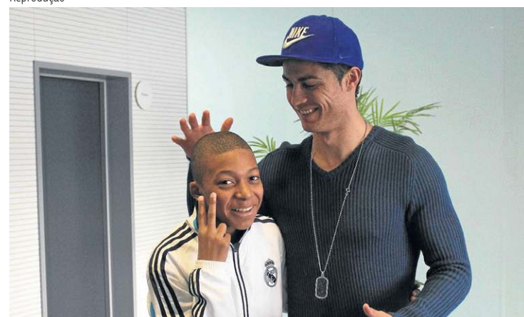
Craque francês era fã de carteirinha de Cristiano Ronaldo e do Real