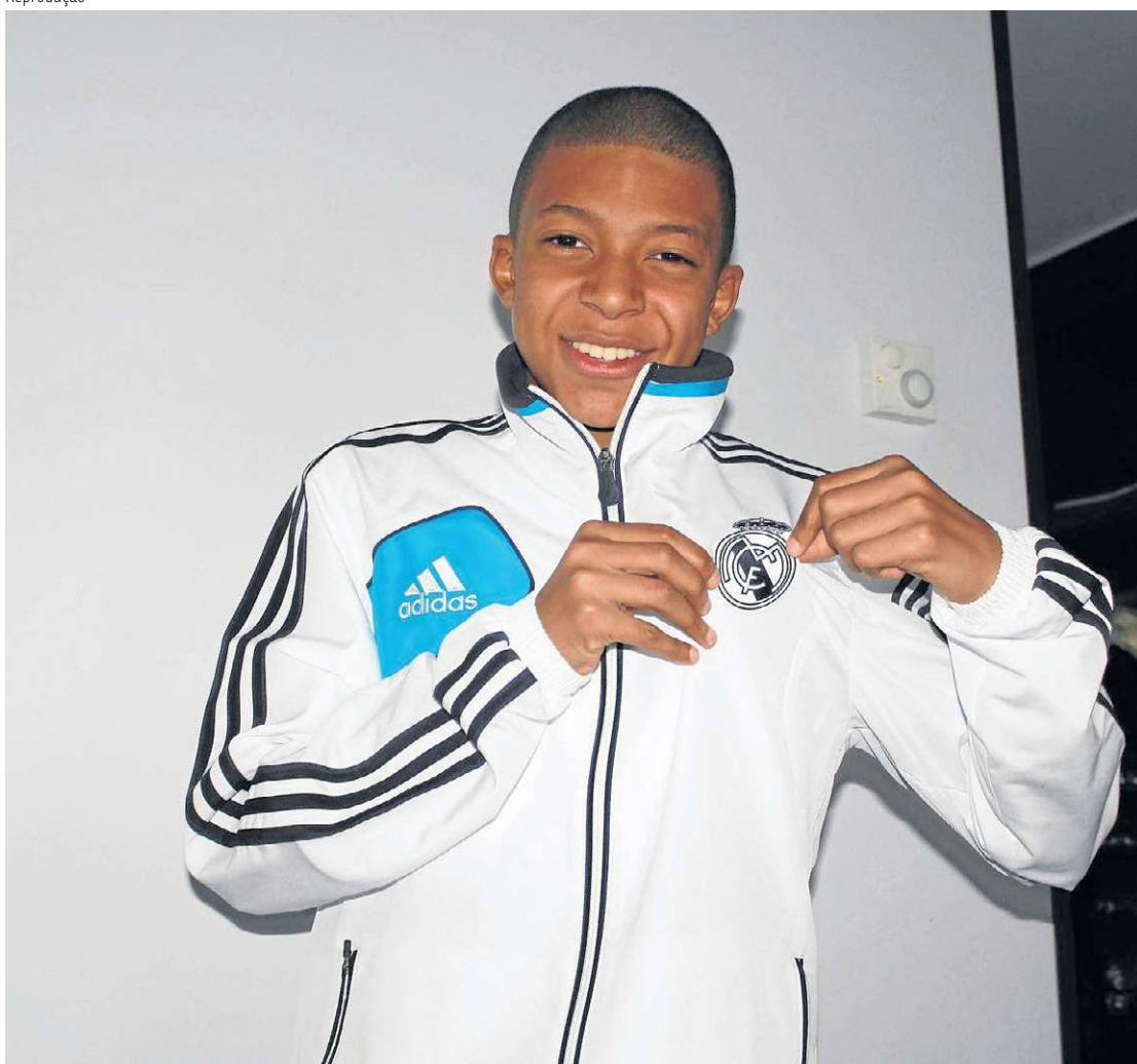
Mbappe nunca escondeu a torcida pelo Real nos tempos de juventude e realizou o sonho de ser jogador do clube

em solo espanhol com a camisa 9, a mesma que o português usou na primeira temporada com a equipe, em 2009. O cinco vezes ganhador da Bola de Ouro aproveitou para responder e desejar boa sorte para o pupilo. “Minha vez de ver. Ansioso para te ver brilhar no Bernabéu”, comentou CR7.